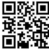
الشكل 1. رمز الاستجابة السريع لتحميل تطبيق A-Learn

A-Learn هي لعبة واقع معزز تعليمية. يمكنك استخدام اللعبة لمسح بطاقات الحروف لتظهر في بيئة واقع معزز، ثم تستطيع دمج هذه الأحرف لتصبح كلمات تظهر بشكل ثلاثي الأبعاد ومن ثم تتفاعل معها.