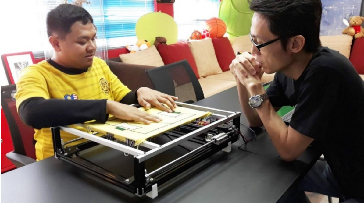
الشكل 3: تجربة المستخدم في Footbraille، (Brohier, 2019)