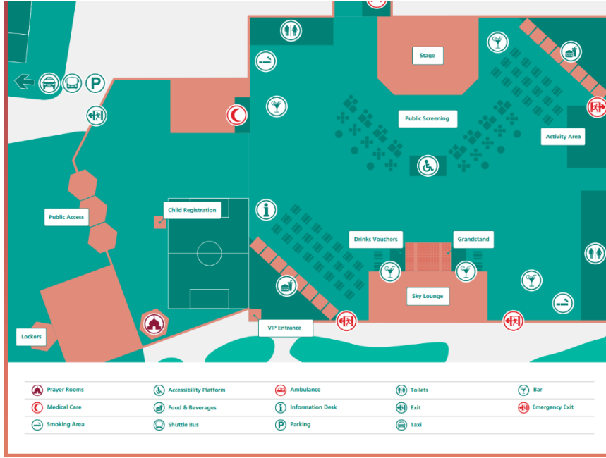
الشكل 2: خريطة منطقة المشجعين لكأس العالم للأندية قطر 2019 - من Alibaba Cloud، 2019