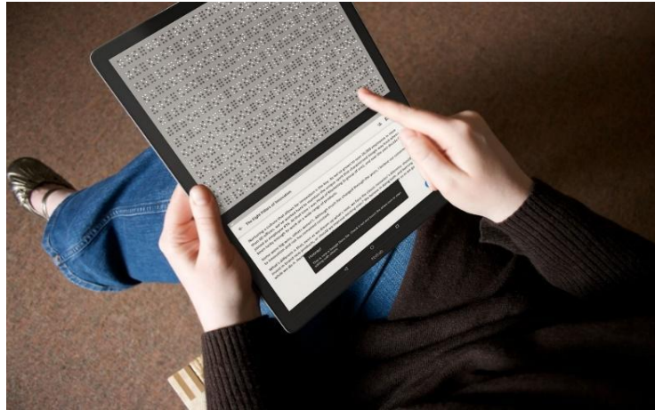
الشكل 2: Blitab

وبنفس القدر من الأهمية ومن أجل معالجة مشكلة العدد المحدود لخلايا برايل المعروضة في سطر واحد في أجهزة برايل الحالية المقترنة بأجهزة الكمبيوتر والأجهزة اللوحية والهواتف الذكية، قامت شركة BLITAB Technology GmbH بإنشاء Blitab وهو عبارة عن جهاز لوحي يعمل بنظام أندرويد مع 14 صفًا تعرض كل منها بطريقة برايل مع 23 خلية برايل سداسية النقاط (الشكل 2). إن الجزء العلوي من Blitab هو عبارة عن شاشة برايل متعددة الأسطر والجزء السفلي به شاشة أندرويد (براونر 2017). وبالطريقة نفسها، طورت شركة PCT جهاز Tactile Pro، وهو جهاز لوحي للمكفوفين فقط لطباعة رسومات برايل وبرائل في الوقت الفعلي جنبًا إلى جنب مع العديد من التطبيقات مثل تحرير المستندات والإنترنت والألعاب، بالإضافة إلى أجهزة الإدخال والإخراج لمدخلات برايل وشاشة اللمس. أما Tactile Edu فهو منتج آخر يهدف إلى دعم آلة تعليم الصور بطريقة برايل لمساعدة ذوي الإعاقة البصرية على تعلم صور برايل وبرائل بواسطة الأدلة الدراسية لروبوت معلم برايل للذكاء الاصطناعي (PCT, 2020).